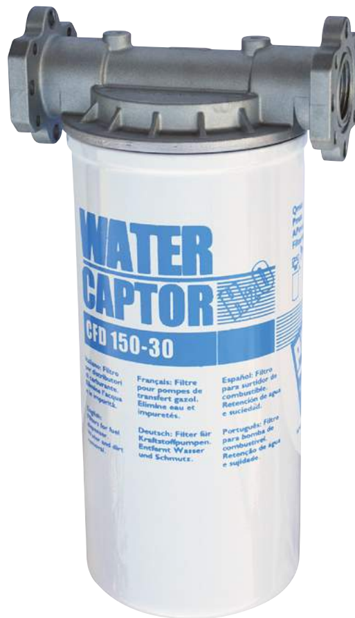
WATER CAPTOR 150 L/MIN