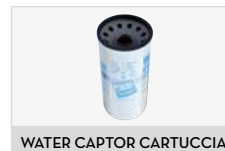
WATER CAPTOR CARTUCCIA