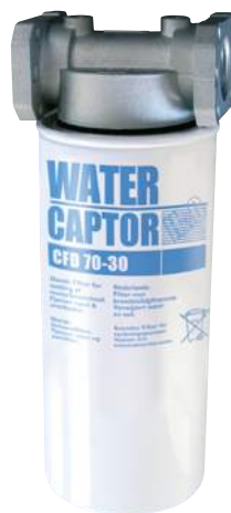
70 L/MIN WATER CAPTOR CON ASSORBIMENTO ACQUA