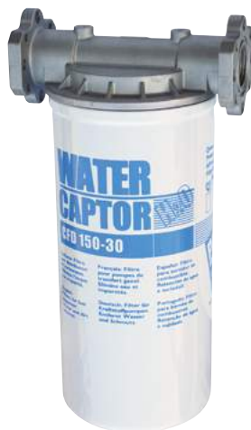
150 L/MIN WATER CAPTOR CON ASSORBIMENTO ACQUA